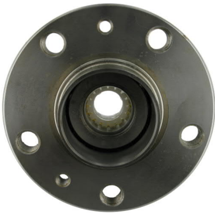
Lagereinheit mit Sicherungshülse

SKF-Lagereinheiten sind mit einer Sicherungshülse versehen, um die Radlagereinheiten während des Transports und der Montage zu schützen. VKBA 3497 wird z. B. mit einer Sicherungshülse geliefert, um die beiden Innenringe in Position zu halten, bis die Radlagereinheit am Fahrzeug montiert ist.